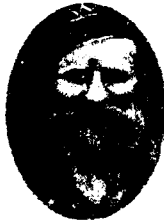
(2) Huzur Swamy Maharaj