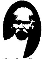
(4) Data Dayal Shrivrat Lali Maharaj