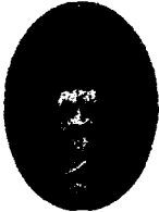
(1) Adisanth Kabir Sahab Maharaj