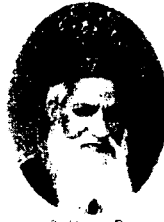
(3) Huzur Roy Satgramy Maharaj